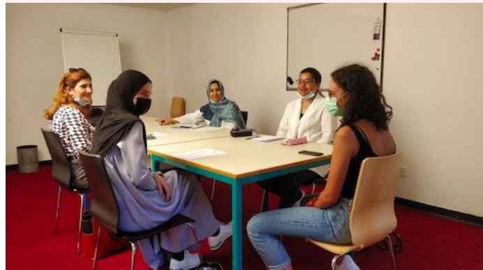
Soirée de français