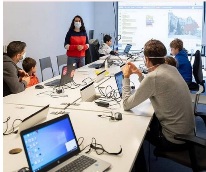
Atelier initiation au code parents-enfants